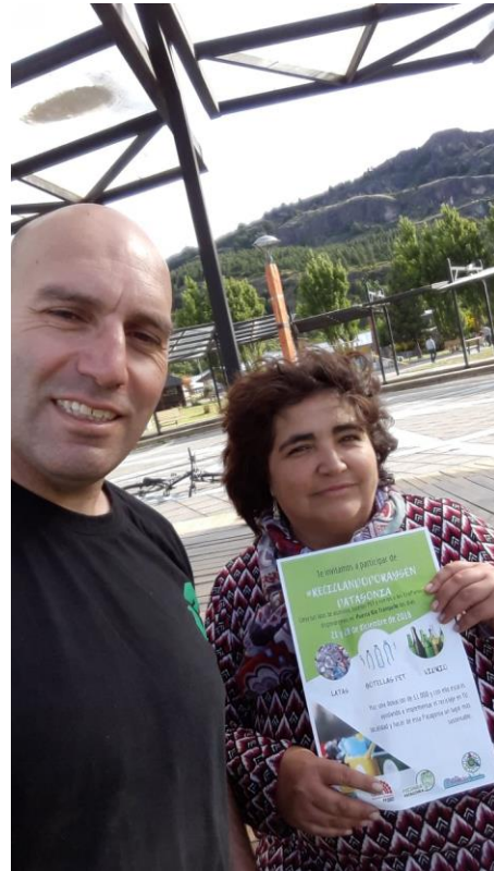
Inscripciones de las empresas a la campaña en el día de lanzamiento