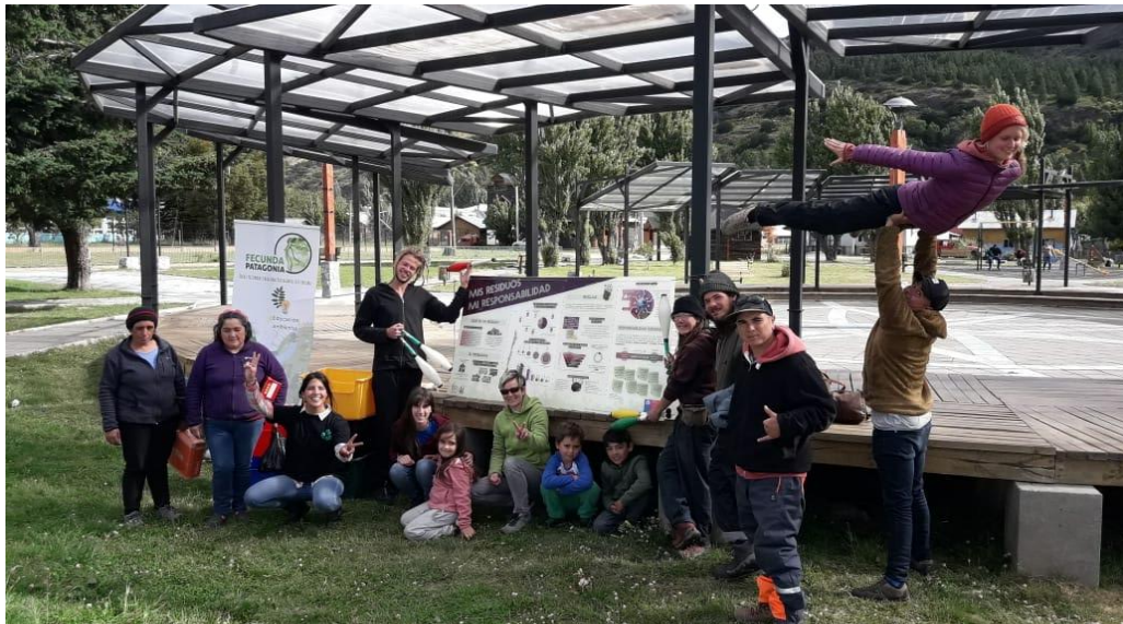
Actividades en el lanzamiento de la campaña