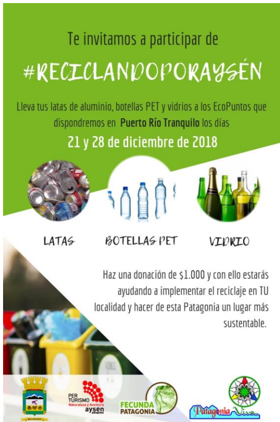
Flayer promocional de la campaña